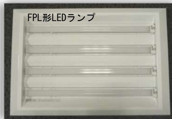
純国産LEDランプ (自社ブランド品)